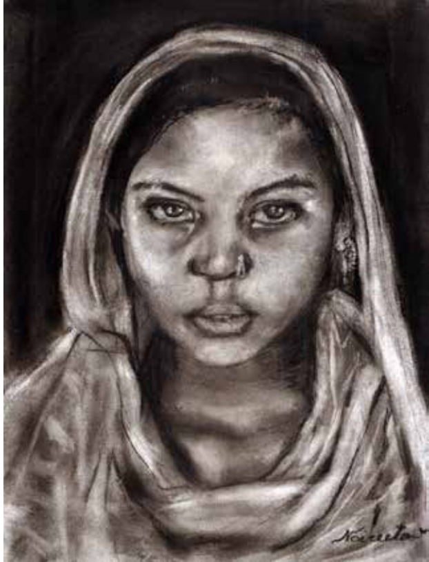
Title: মেয়ে, Media: Charcoal Size: 26 cm x 19.5 cm