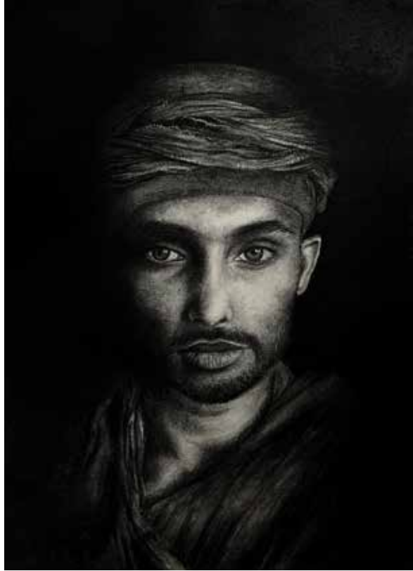
Title: Eyes Speak, Media: Charcoal Size: 38 cm x 56 cm