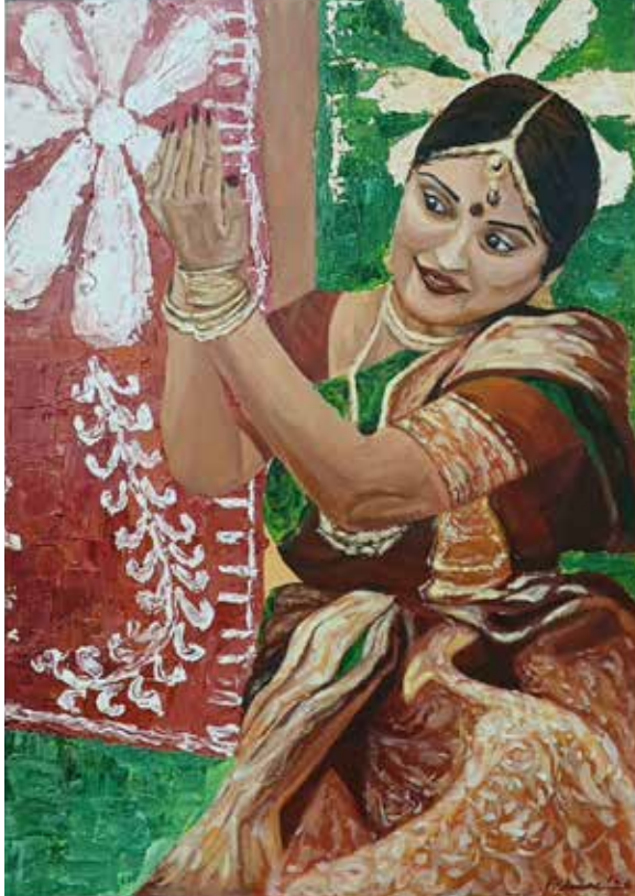
Title: অঞ্জলি লহ মোর, Media: Acrylic Size: 42 cm x 59.4 cm