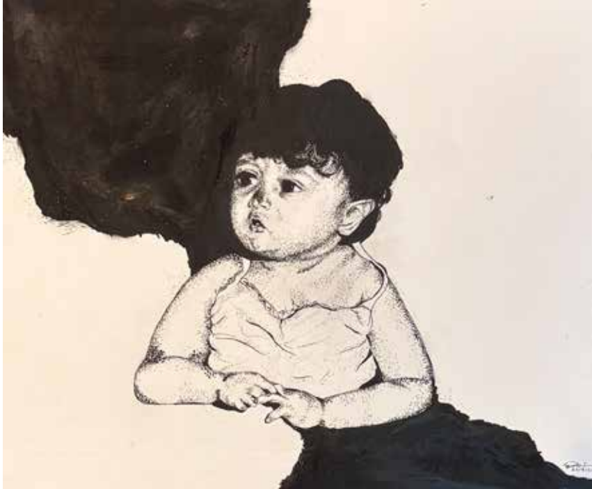
Title: Childhood, Media: Stippling with Marker on Paper Size: 55 cm x 50 cm