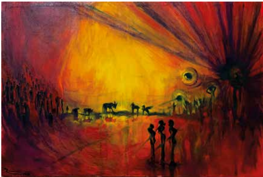
Title: স্বর্গ, Media: Oil Size: 92 cm x 62 cm