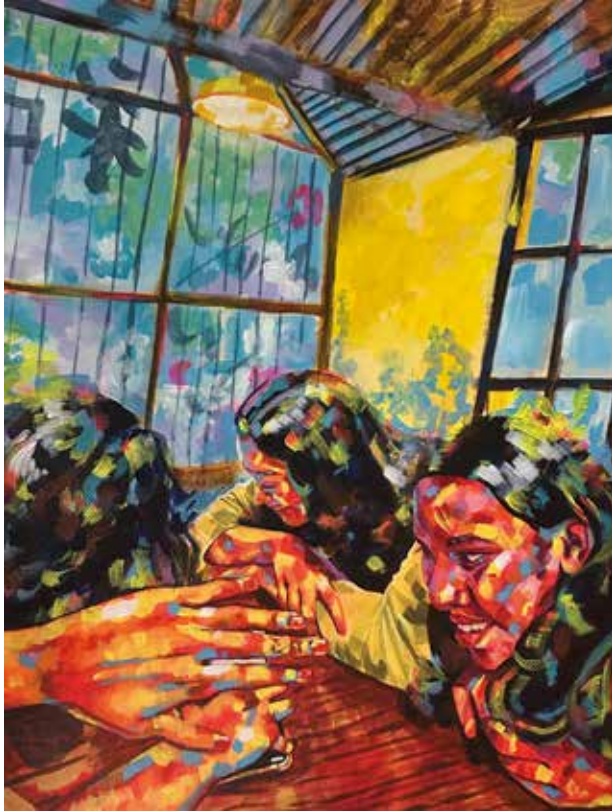
Title: গল্প গুজব, Media: Acrylic Size: 45.5 cm x 35 cm