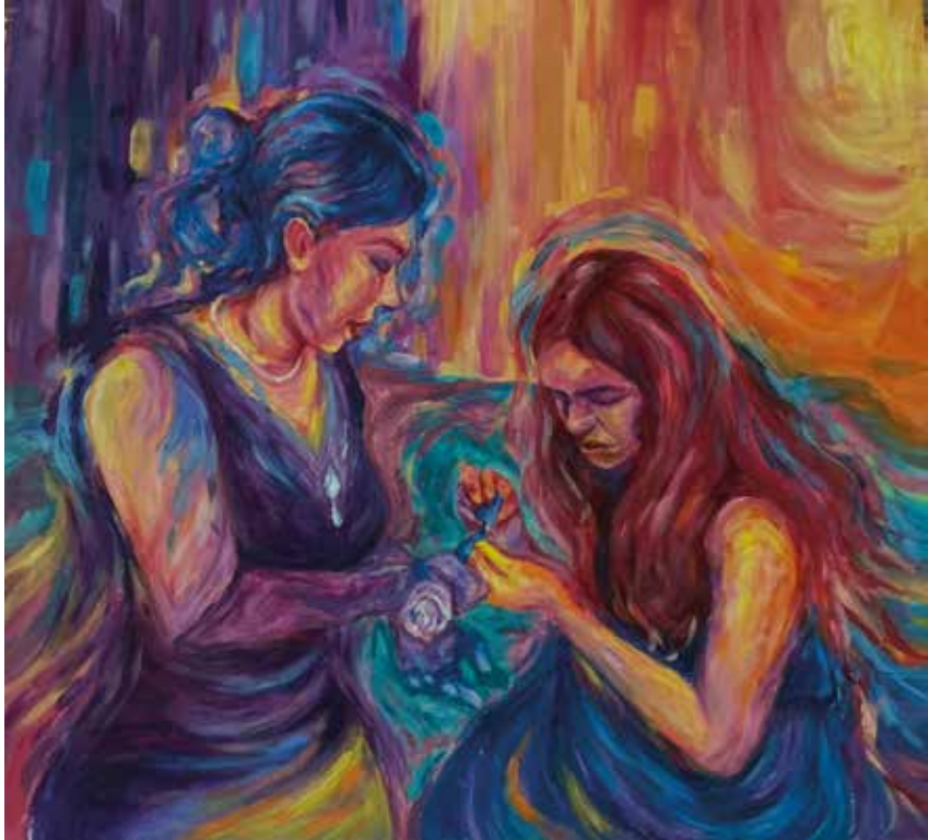
Title: Prom Night, Media: Acrylic Size: 41.5 cm x 45 cm