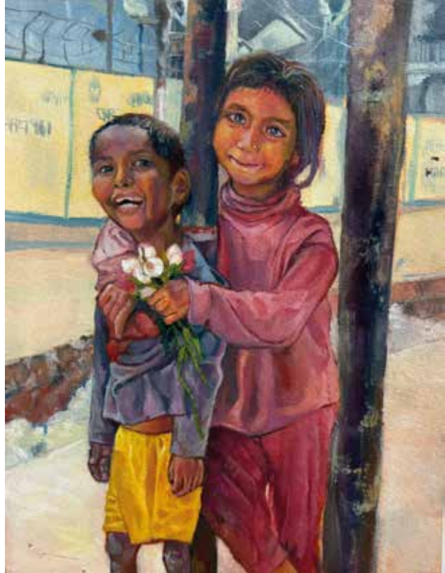
Title: Shared Light, Media: oil paint Size: 29.21 cm x 21.59 cm