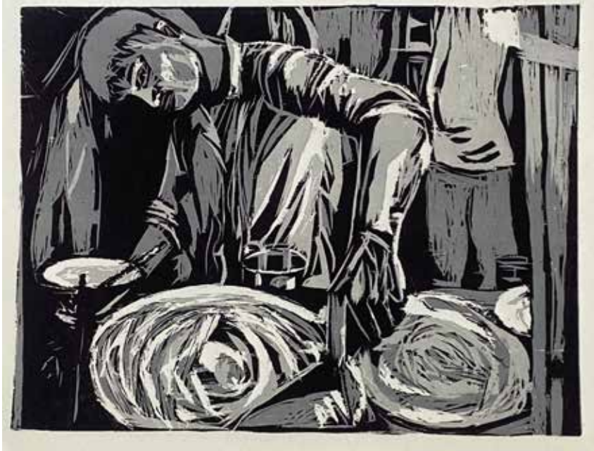
Title: A Tale from the Tawa, Media: Woodcut Print Size: 17.78 cm x 27.94 cm