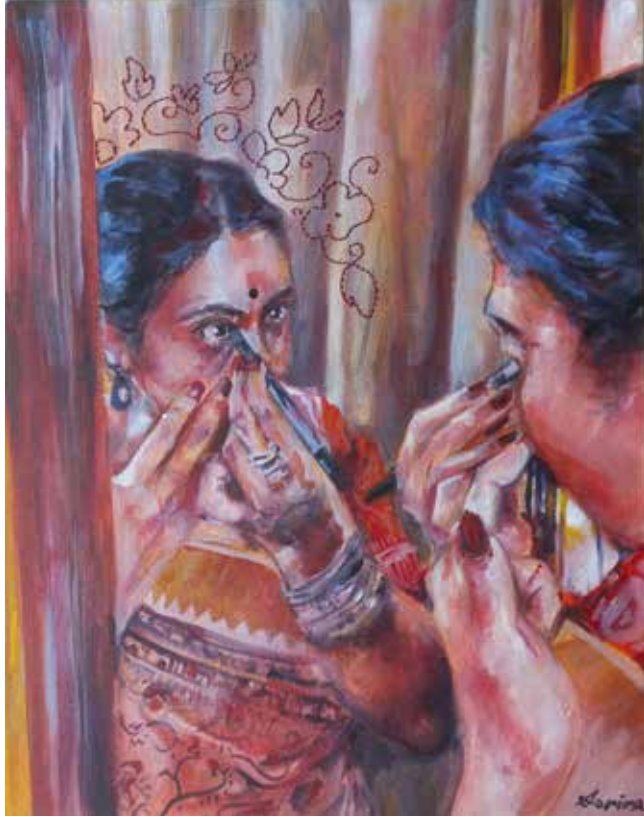
Title: প্রতিবিম্ব, Media: Mixed Media on canvas Size: 45.4 cm x 35.3 cm