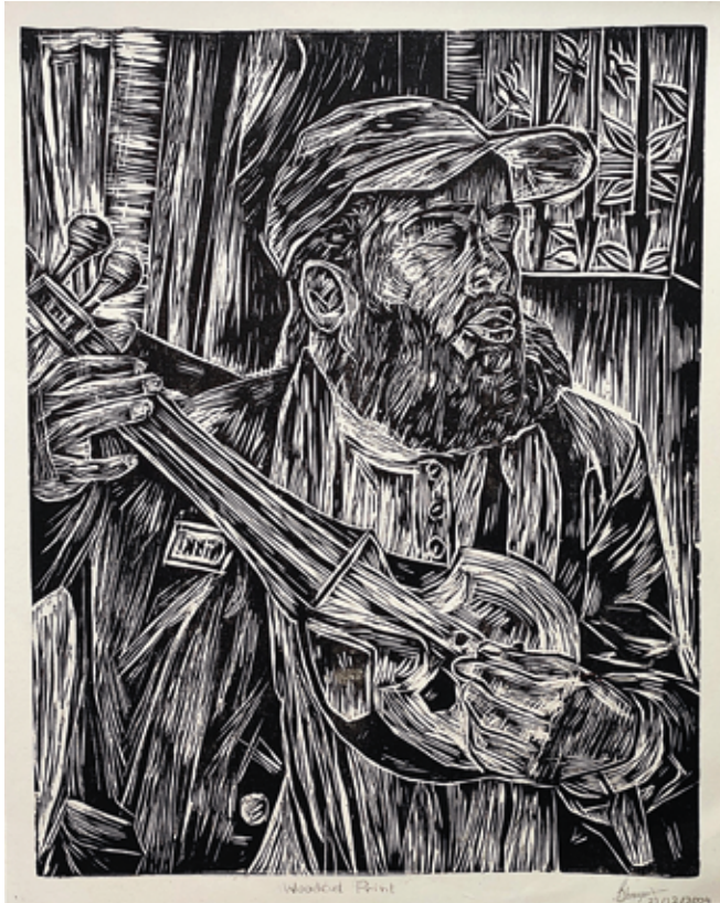
Title: চিরন্তন, Media: Woodcut Print Size: 33.5 cm x 43.1 cm