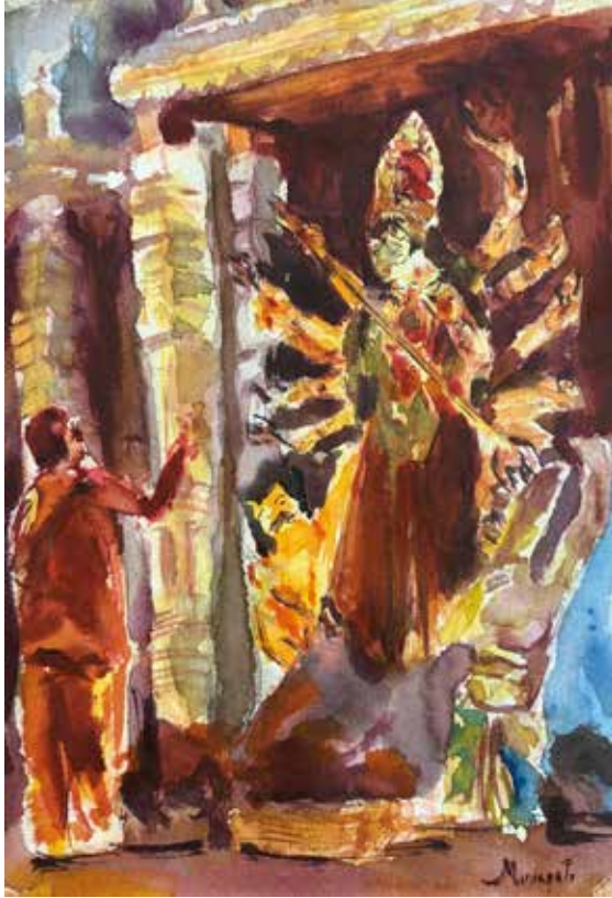
Title: Metaphysical Connection, Media: Watercolour Size: 19.5 cm x 28.5 cm