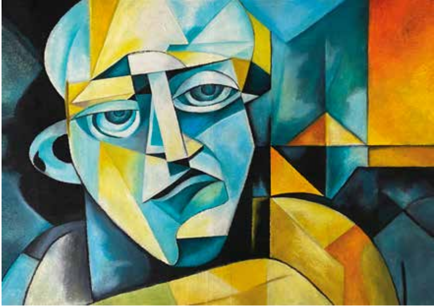
Title: Weight of Reflection, Media: Oil Pastel Size: 37.1 cm x 26.7 cm