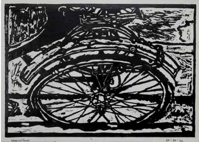
Title: জীবনচক্র (Jibon Chakra), Media: Woodcut Size: 46.1 cm x 32.5 cm