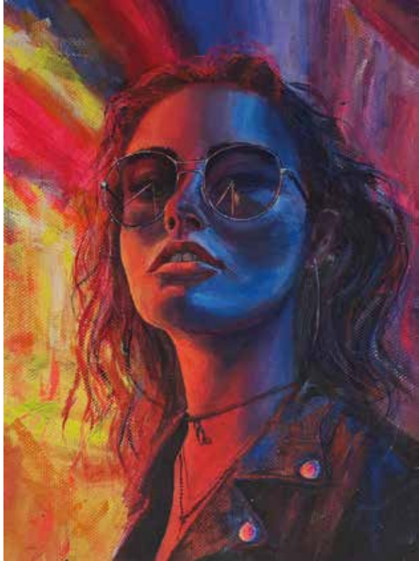
Title: Chromatic Defiance, Media: Acrylic Size: 30.3 cm x 23 cm