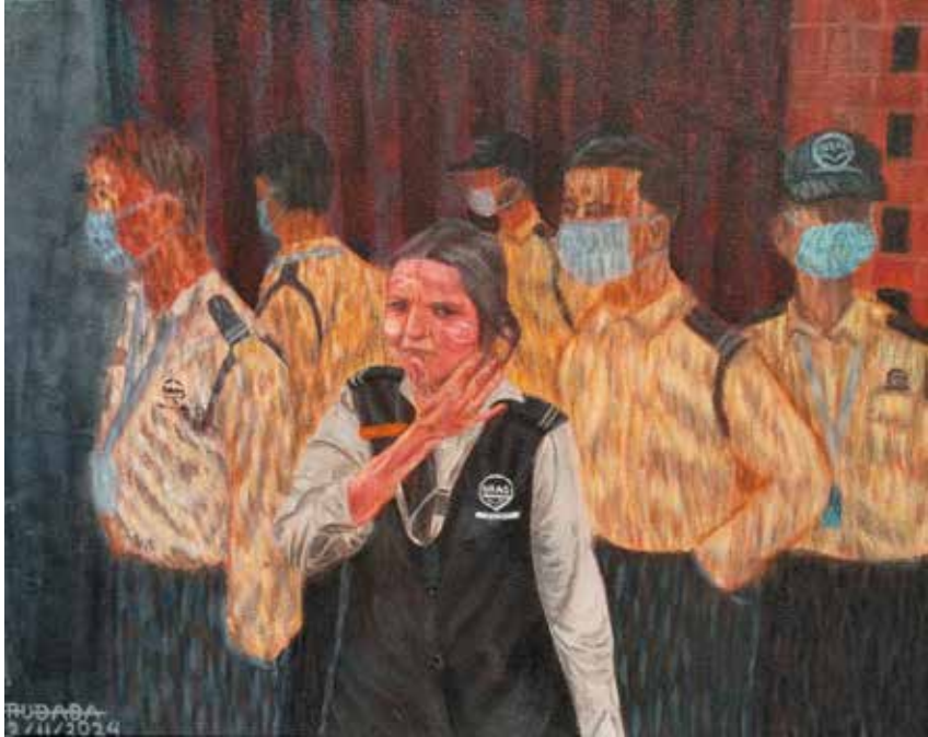
Title: The Guardians, Media: Acrylic on Canvas Size: 51 cm x 40 cm