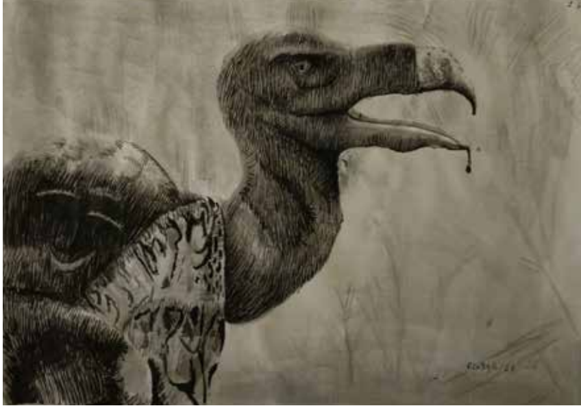
Title: Vulture in the Savannah, Media: Ink Wash Size: 42 cm x 29.7 cm