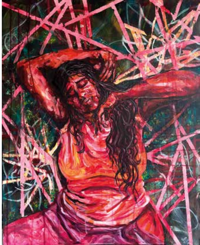
Title: Anatomy of a Sin, Media: Acrylic on canvas Size: 76 cm x 61 cm