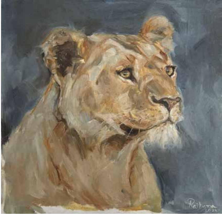
Title: Her, Media: Oil Painting on canvas Size: 50.8 cm x 50.8 cm