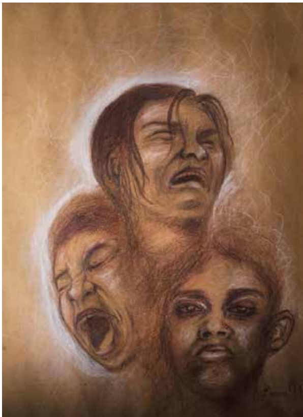
Title: আর্তনাদ-২, Media: Mixed Media Size: 35 cm x 50 cm